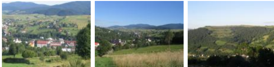
Rycina 1. Ukształtowanie terenu Gminy Niedzwiedź